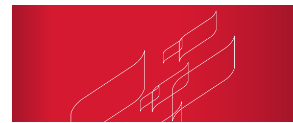
Frontansicht Grafik ca. 800 mm