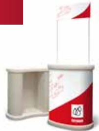
Standmaß der Theke: 1040 x 850 x 500 mm (H x B x T)